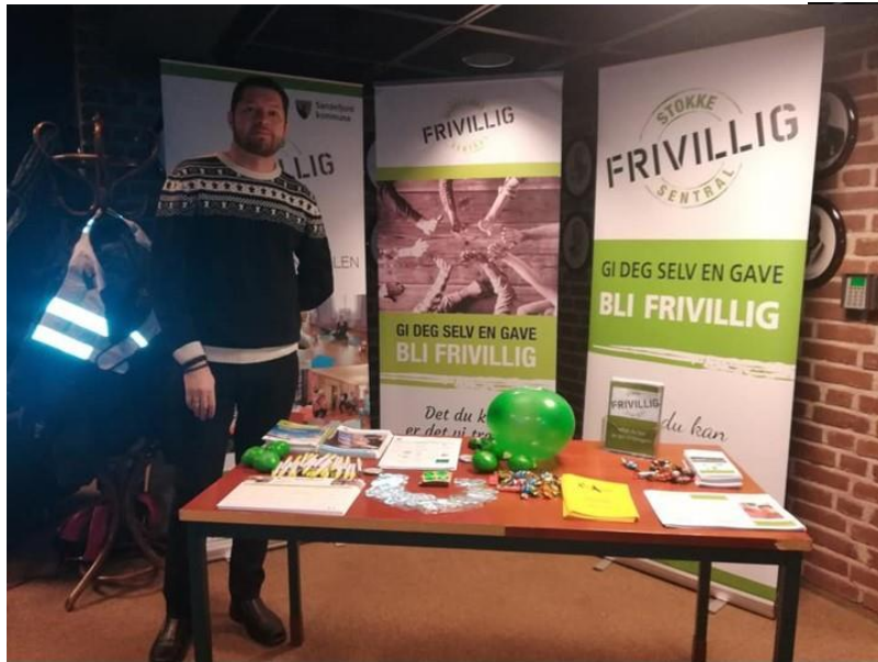
Jorge deler ut info fra alle tre Frivilligsentralene