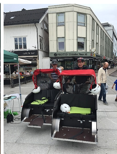
Stand på torget 11.juni.