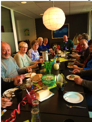
Hver fredag er det lunsj på sentralen