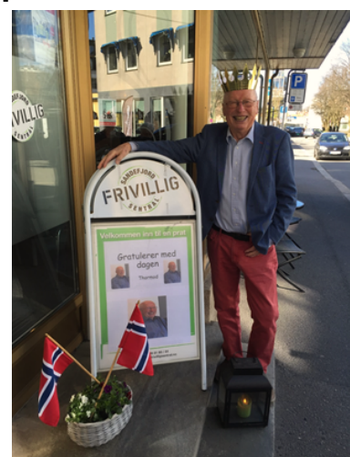
Sprek 80 – åring