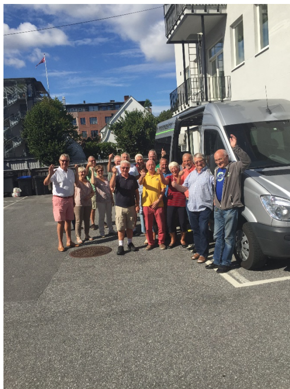
«Ny» bil kom inn i bilparken sommeren 2016.