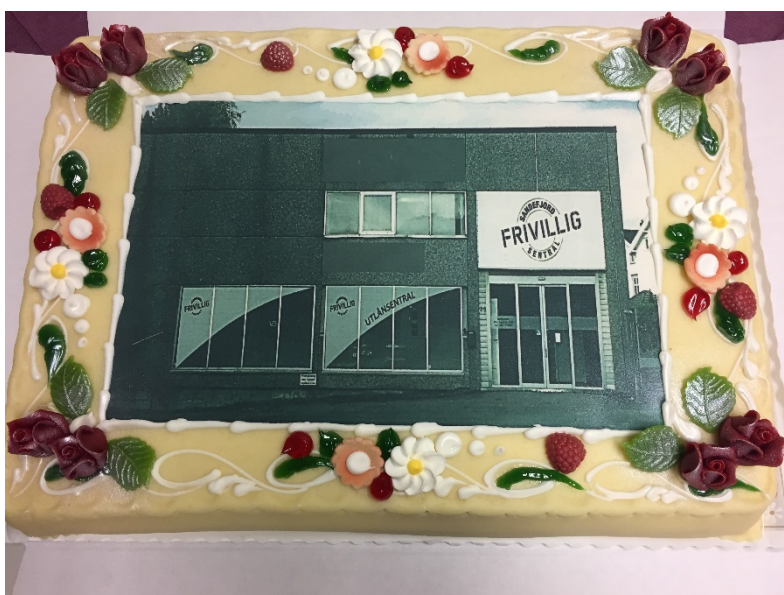
Åpningen 21.november 2016

Våren 2016 søkte vi Sparebankstiftelsen om tilskudd til innkjøp av vinterutstyr så vi kunne starte en Utlåsentral. Tilbudet skal være gratis og alle mellom 18 og 30 år. Vi fikk kr. 100.000 Vi søkte kommunen og fikk kr.12.000 + at vi får låne flotte lokaler i Stockfleths gate 28 En kjempegod avtale med Gjertsen sport fikk vi så var prosjektet i gang. Ivrige frivillige er med på å administrere Utlåsentralen. Den 21.november hadde vi offisiell åpning, der en representant fra Sparebankstiftelsen var tilstede. De ble imponert. Dette er et prosjekt vi har stor tro på