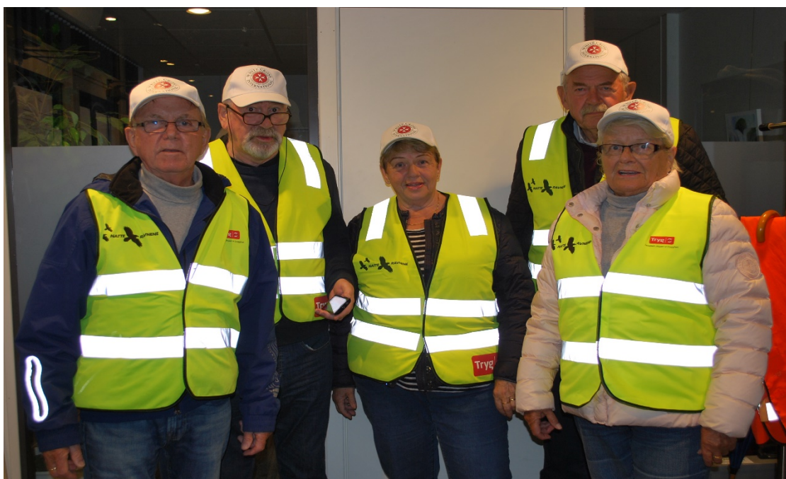
White.Cross har i 2016 vært ute og gått mange lørdager. Tusen takk!